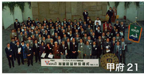
周年記念で新クラブを設立