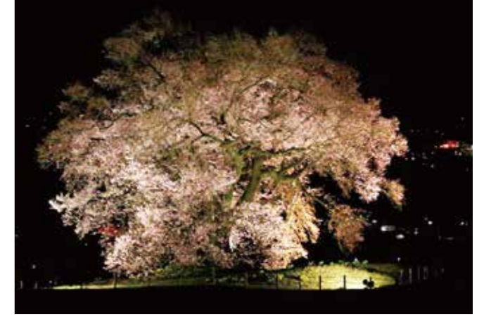
王仁塚の桜