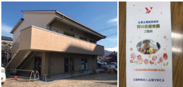
山梨YMCA「野の花保育園」の引き渡しが無事完了

「現在の苦しみは、将来わたしたちに現われるはずの栄光に比べると取るに足りない」(ローマの信徒への手紙8-18節) そう聖書が示すように、この苦しみは神様が私たちに必要なだけ与えてくれる試練なのだ、とポジティブに受け止め、しっかりと向き合っていきたいものです。2020年度は甲府ワイズは70周年、甲府21は30周年の大きな節目の年です。そんな年を新会館で迎えられる、こんな幸せな偶然は他にあるでしょうか。これからもYMCAは皆様と共にあります。5月2日に献堂式、6月には定期総会、11月にはバザーとチャリティーラン、すべてが盛會に終わりますように心よりお祈り申し上げます。