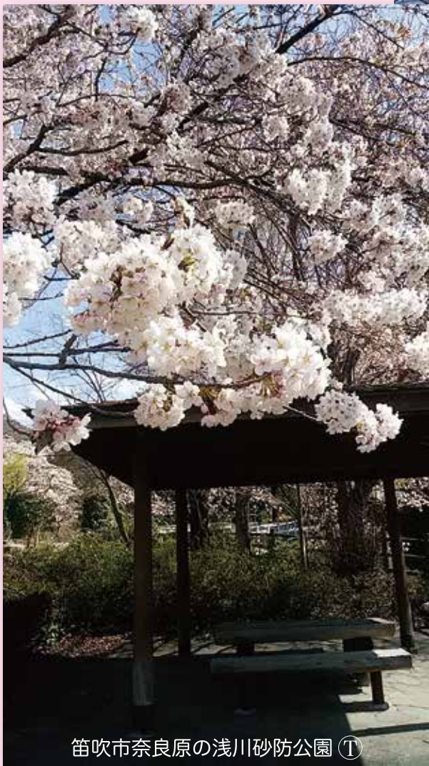
笛吹市奈良原の浅川砂防公園 ㊦