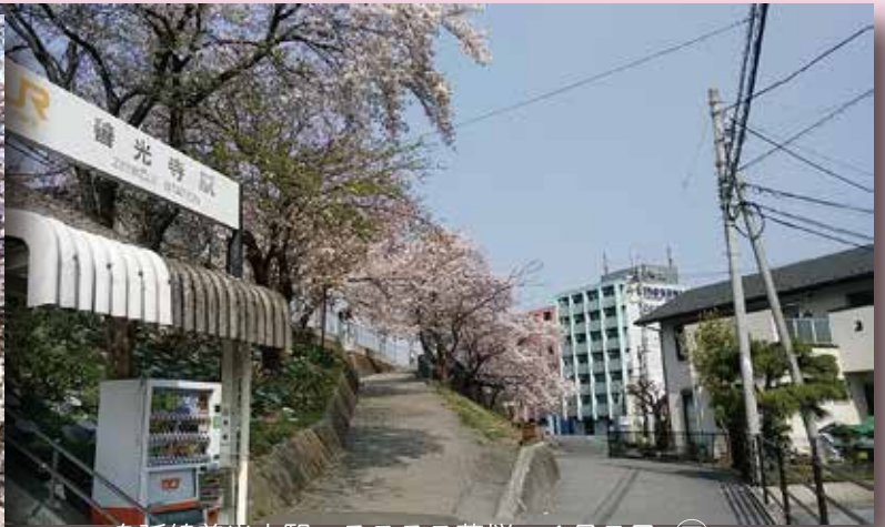
身延線善光寺駅 そろそろ葉桜 4月7日 ㊧