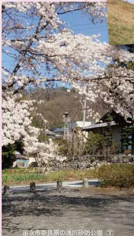
笛吹市奈良原の浅川砂防公園 ㊦