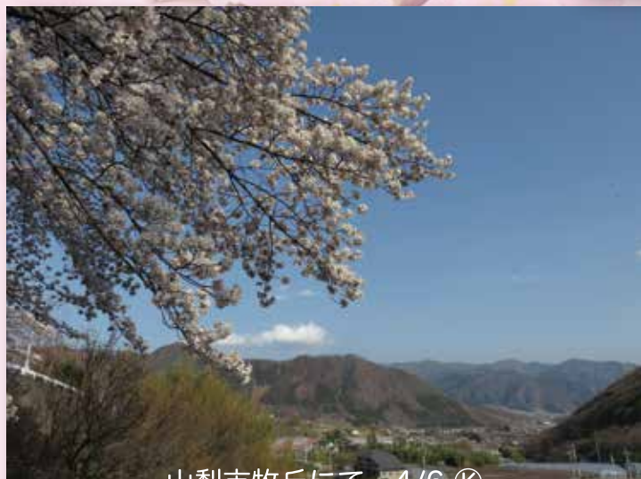
山梨市牧丘にて 4/6 ㊩