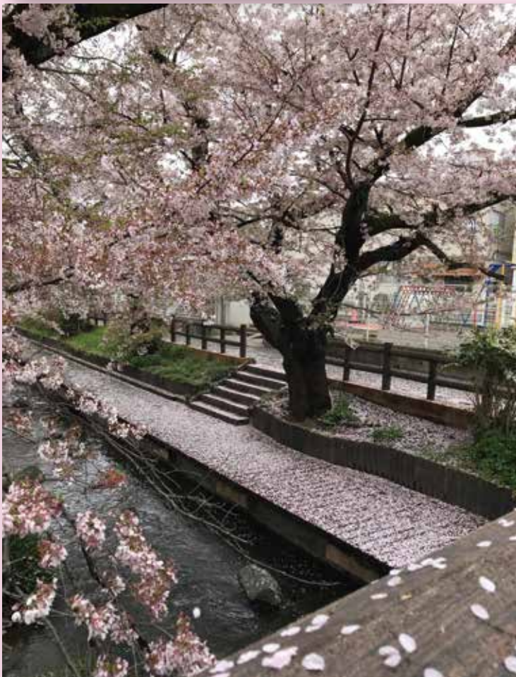
川崎市宿河原二ヶ領用水の散り始めたさくら 4月7日 ①