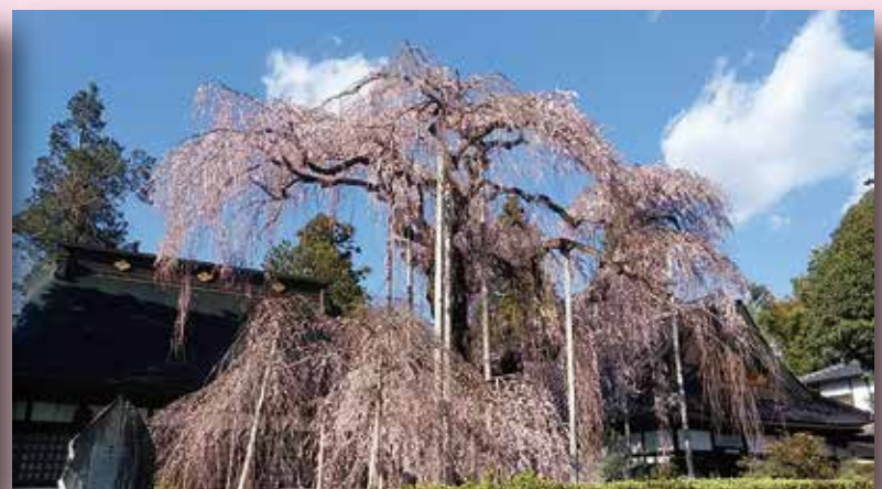
塩山慈雲寺の糸ザクラ5分咲き ㊪