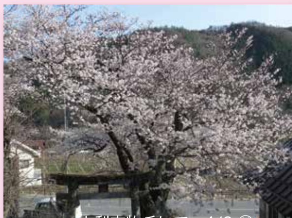
山梨市牧丘にて 4/6 ㊩