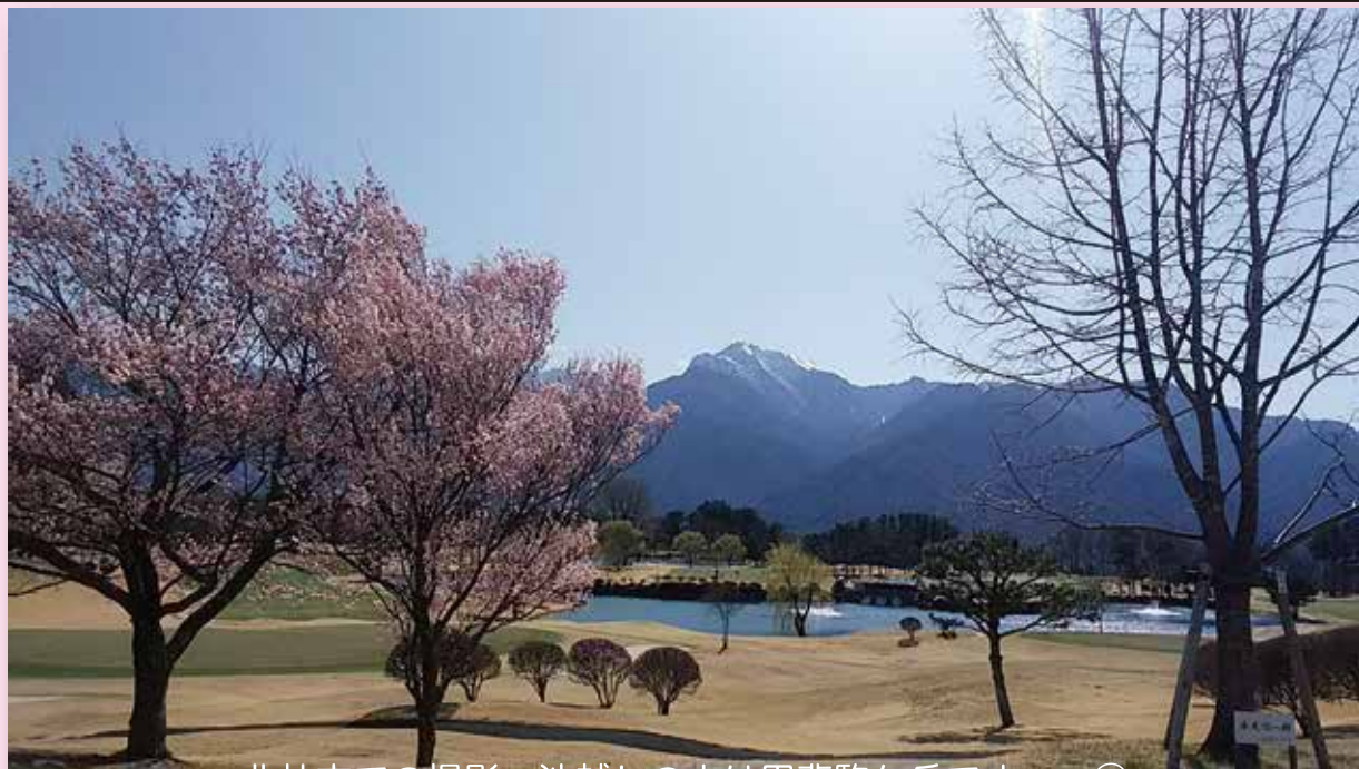
北杜市での撮影 池越しの山は甲斐駒ヶ岳です。 ㊦

「・・・・・・・・さくら、さくら、今咲き誇る、 刹那に散りゆく運命と知って・・・・・・・・さ くら、さくら、いざ舞い上がれ、永遠にさ んざめく光を浴びて・・・・・・・・」