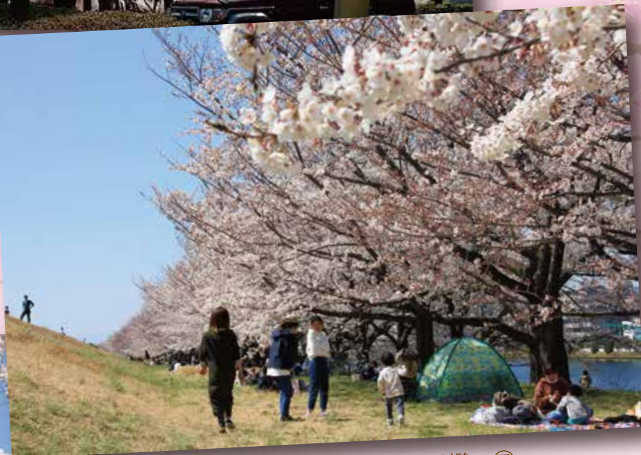
戸田公園 家族でさくら団欒 ㊦