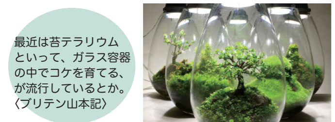
最近では苔テラリウム といって、ガラス容器 の中でコケを育てる、 が流行しているとか。 (ブリテン山本記)

遠くから見るもの、近づかなければ見えないもの、体験しなければわからないもの、この一年そんな思いとポケ防止策に探求に励みたいと思います。