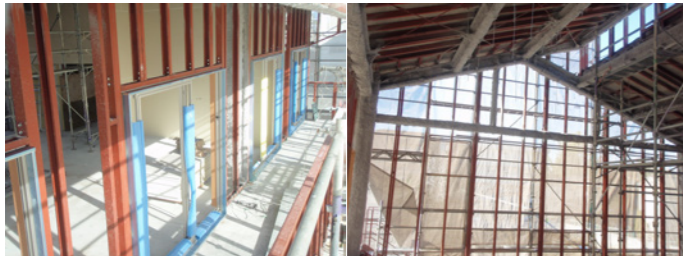
*2階南側ベランダ *2階地域交流室より