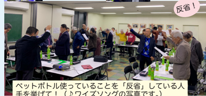
ペットボトル使っていることを「反省」している人手を挙げて!(♪ワイズソングの写真です。)