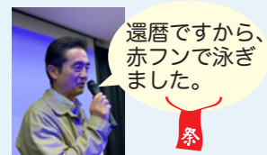
還暦ですから、赤フンで泳ぎました。