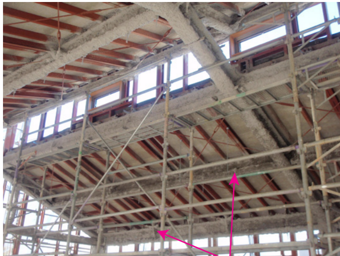
*2階地域交流室より天上をのぞむ。もこもこは耐火被覆材。