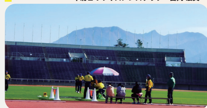
会場は小瀬スポーツ公園山梨中銀スタジアム